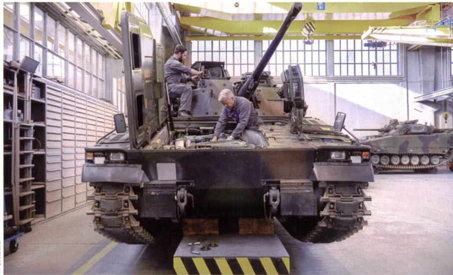
Ein RUAG-Kerngeschäft: Unterhalt für unsere Armee, hier am Schützenpanzer.

Das erste Halbjahr 2019 stand für die RUAG im Zeichen der Entflechtung und Umstrukturierung. Wie erwartet wirkt sich dies auf das Halbjahresergebnis aus. Gesamthaft liegt der EBIT mit 19 Mio. Franken hinter dem Vorjahr (41 Mio.) zurück.