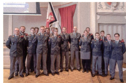
«Sie haben die beste Führungsausbildung der Schweiz bestanden»: Der designierte Chef der Armee, Divisionär Süssli, gratulierte den jungen Artillerieleutnants zur Beförderung.