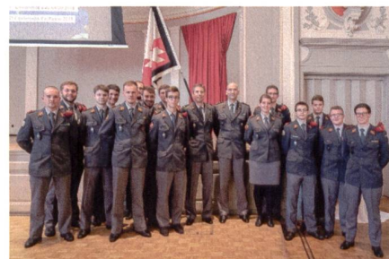
«Sie haben die beste Führungsausbildung der Schweiz bestanden»: Der designierte Chef der Armee, Divisionär Süssli, gratulierte den jungen Artillerieleutnants zur Beförderung.