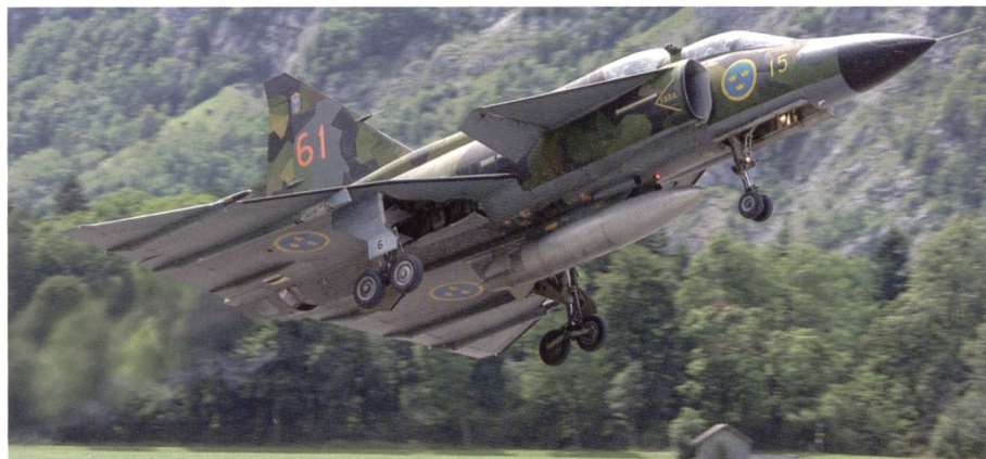
Am Zigermeet in Mollis flog der Saab Viggen in Tarnbemalung – Seiten 16–17.