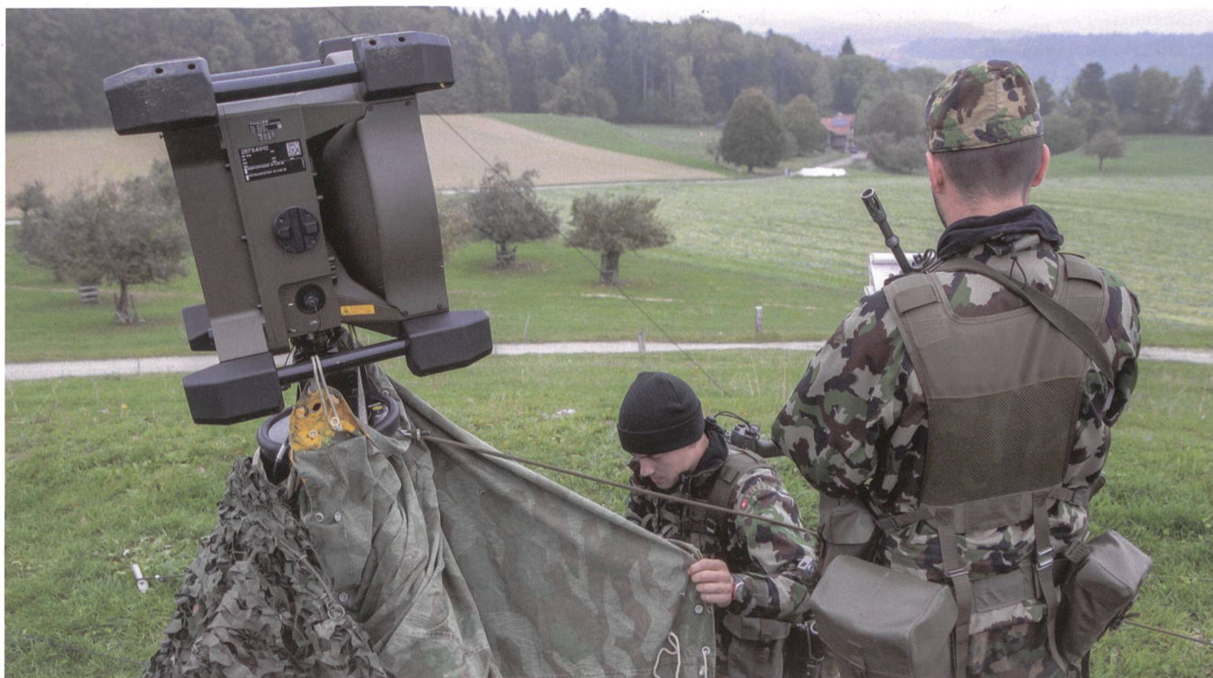
Irgendwo in der Schweiz auf topografisch gut gelegenem Gelände: eine Richtstrahlschüssel.