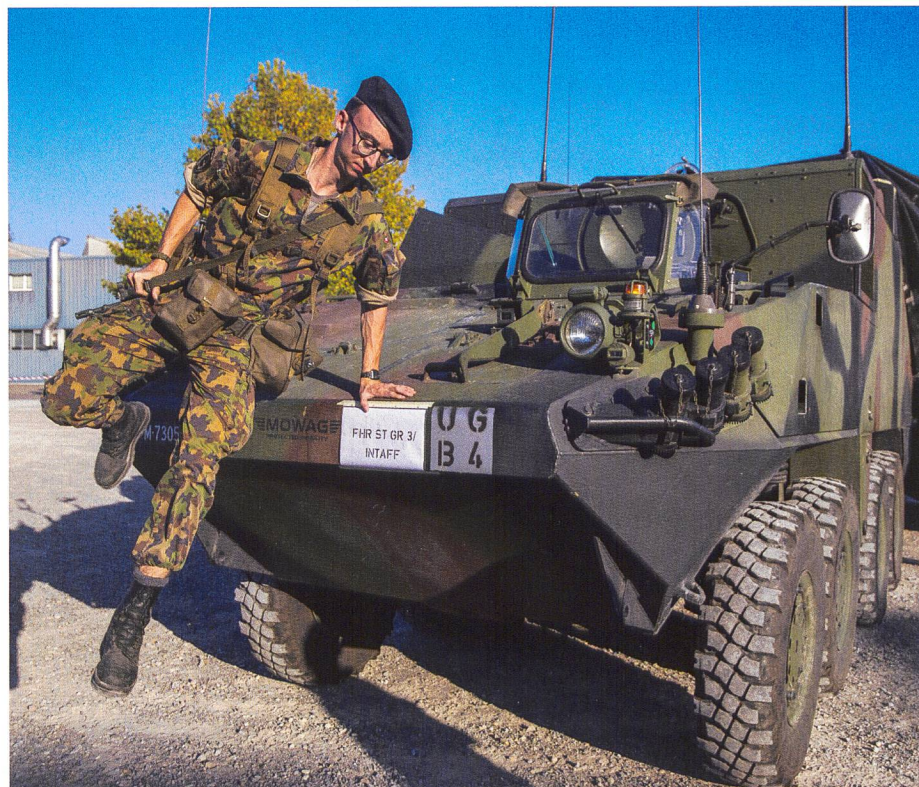
Schwungvoll ins Gefecht – mit eleganter Flanke vom Führungsstaffel-Fahrzeug.