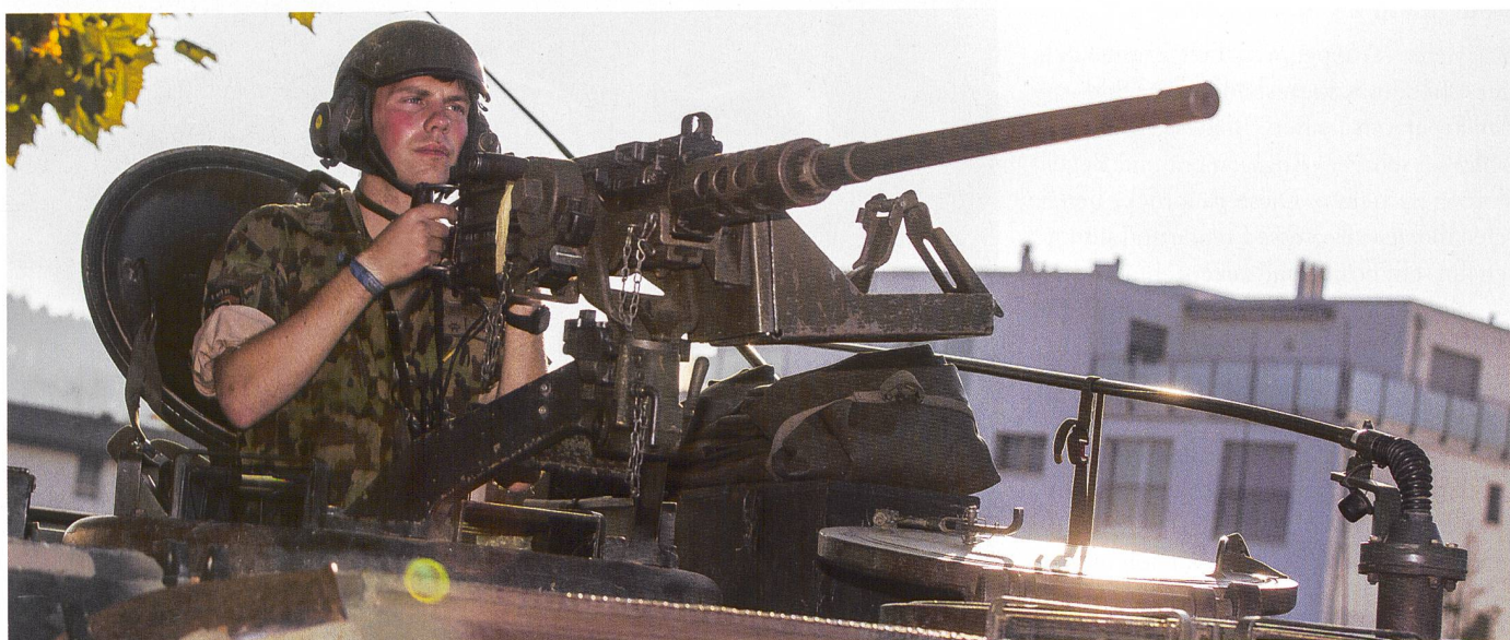
Silbergraue im Schuss: Bereit zum Einsatz in der grossen Übung «COMPOSITO» des Lehrverbandes FU.