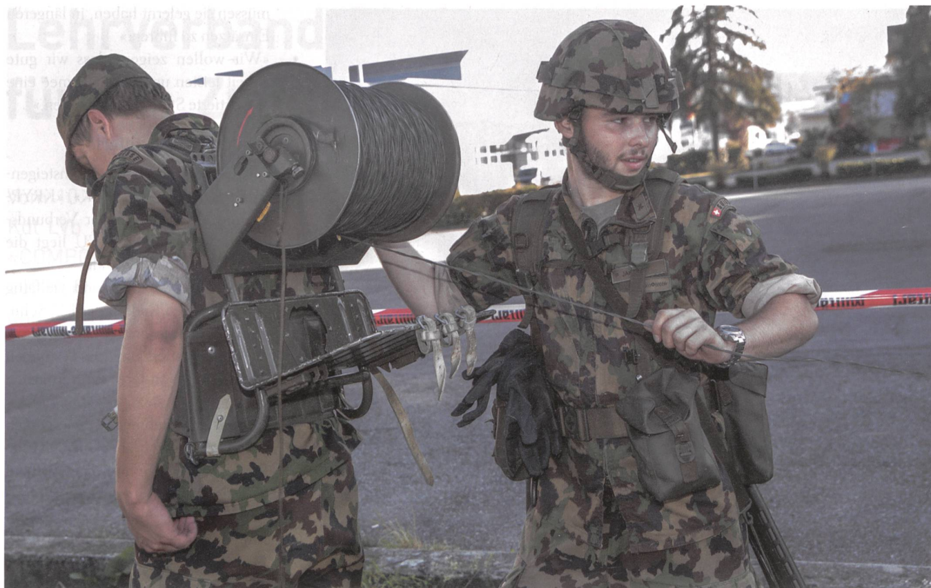
Ein traditionelles Bild vom Engagement unserer Silbergrauen. Kameraden im Einsatz.