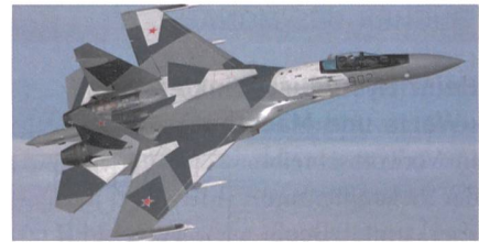
Suchoi Su-35 für die Türkei?

Die Türkei ist für die Vereinigten Staaten von Amerika kein zuverlässiger Militärpartner mehr, daher hat man das Land aus dem F-35 Programm ausgeschlossen. Als Hauptgrund dafür gilt der Kauf des russischen S-400 Flugabwehrsystems. Die USA