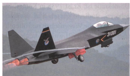
Chinesisches Stealth-Kampfflugzeug AVIC FC-31.