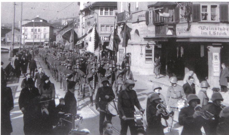
100 Jahr-Jubiläum: Am 4. März 1939 marschiert die Gründungssektion des Limmatquai hinauf zur Forchbahnstation am Stadelhofen.