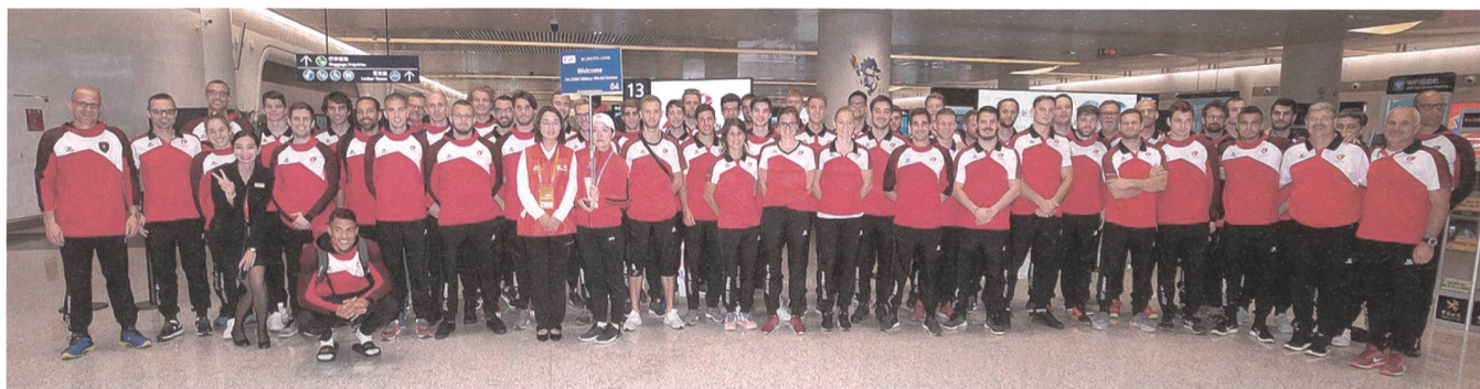
Bei der Ankunft in China.