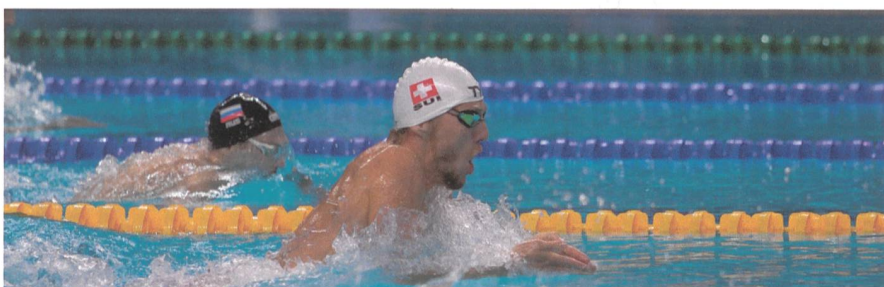
Und als Schwimmer erfolgreich.