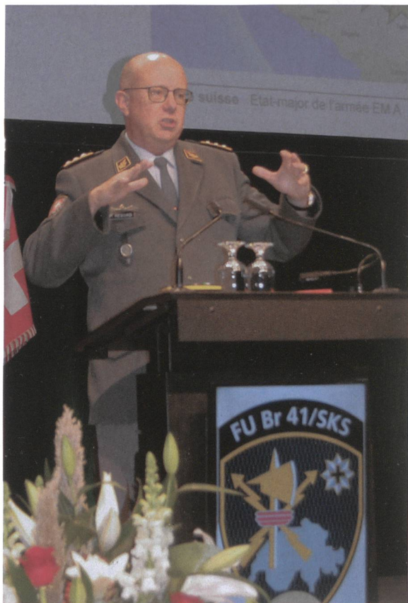
Der Chef der Armee spricht zur FU Brigade.