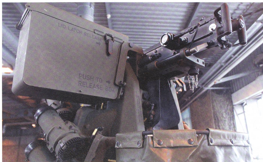
Die Waffenstation für den Nahbereich: Der Mörser-Kdt bedient das 12,7-mm-MG mit angebauten Nebelwerfern. Er setzt die Waffenstation ferngesteuert ein.