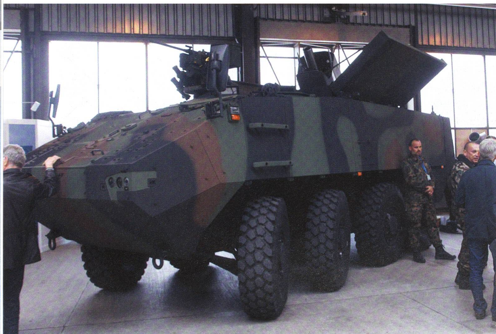
Unser Fotograf Major Kevin Guerrero nahm den Mörser 16 in Frauenfeld auf.

Bis 2009 unterstützte der 12-cm-Minenwerferpanzer 64/91 die Kampfverbände der Infanterie, Panzergrenadiere und Panzer. Dann entstand eine empfindliche Lücke. Mit dem Rüstungsprogramm 2016 beschlossen die Räte, es seien 32 RUAG-Mörser COBRA zu kaufen. Die Beschaffung geht zeitgerecht voran. Im September präsentiert die Mowag, die dem System den Piranha IV stellt, in Bürglen den neuen Panzer mit dem 12-cm-Rohr der SOGART, den Schweizer Artillerieoffizieren.