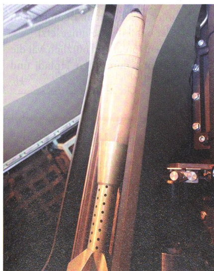
Vereinfachte Bedienung: Die Mörsergranaten werden automatisch geladen.