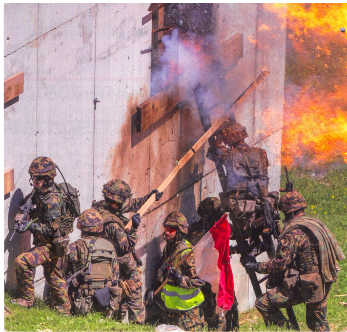
Grenadiere dringen in ein feindlich besetztes Haus ein.