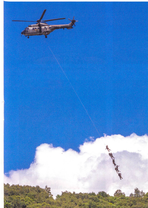
Kühne Aktion: Ein Helikopter zieht zehn Mann, gegliedert in fünf Paare, nach erfülltem Einsatz aus dem Gefechtsfeld.