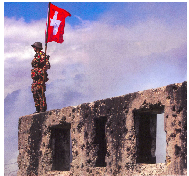
Blick in die Geschichte, aber die Treue zur Fahne bleibt aktuell.