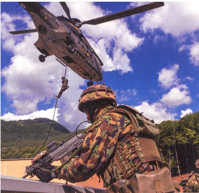
Grenadiere zeigen am 75-Jahre-Jubiläum ihr enormes Können.