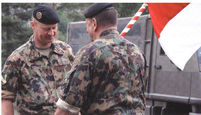
Mech Br 11: Von Br Brülisauer zu Div Wellinger...