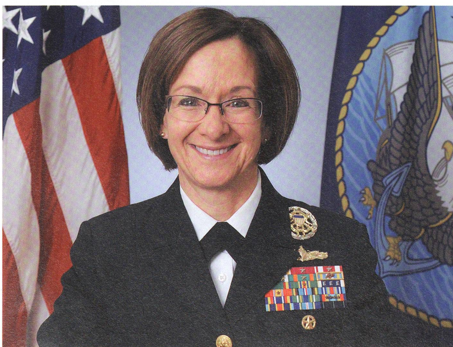
Vizeadmiral Lisa M. Franchetti, Kommandant der 6. US Flotte im Mittelmeer.