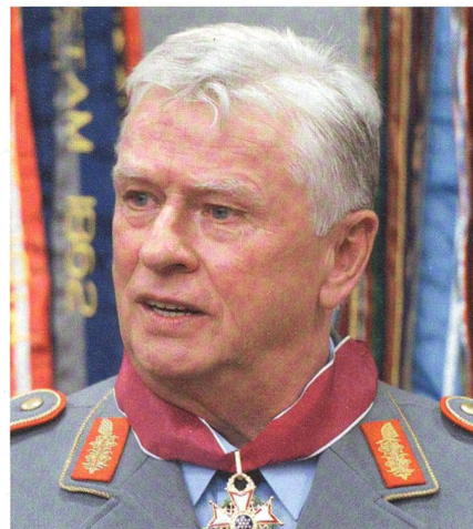
Volker Wieker, der Generalinspekteur mit der längsten Amtszeit (2010–2018).