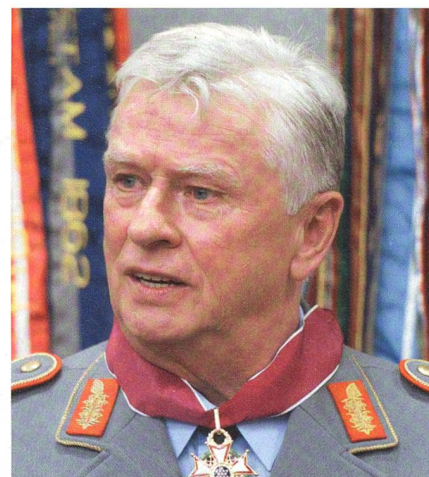
Volker Wieker, der Generalinspekteur mit der längster Amtszeit (2010-2018).