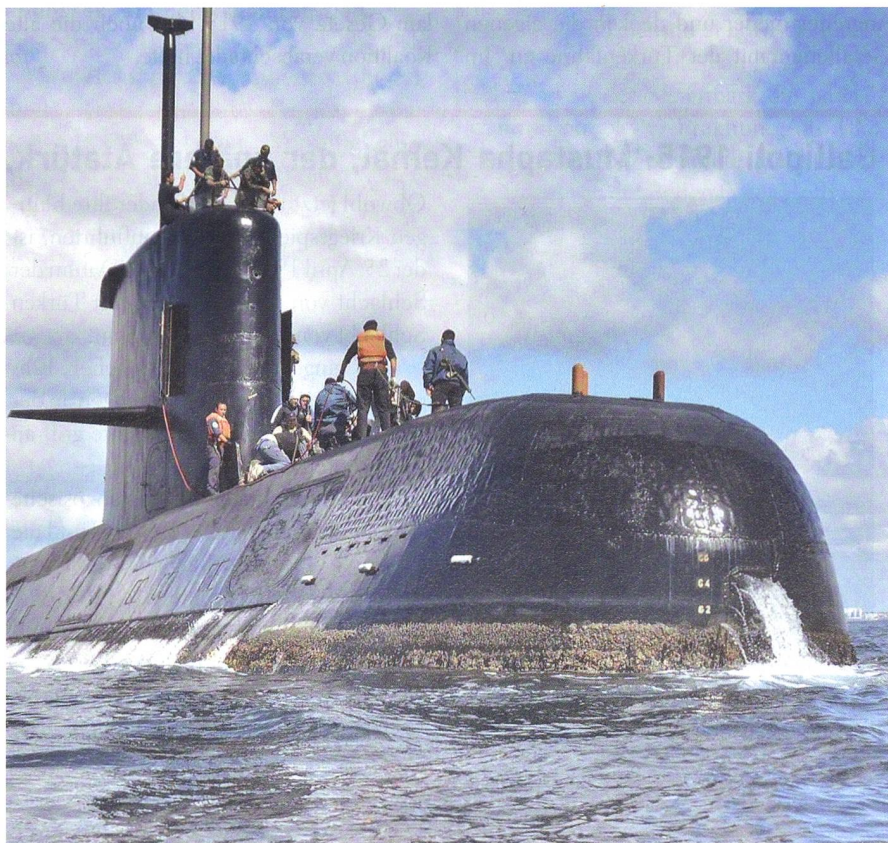
Das argentinische Unterseeboot ARA San Juan vor dem Verschwinden im Atlantik.