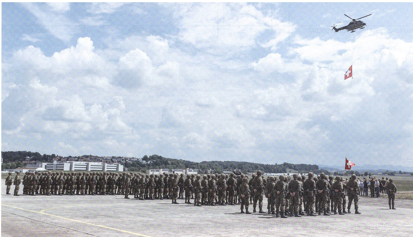
Hoch über dem Bataillon mit dessen Standarte zieht ein Super Puma mit der Schweizerfahne seine Bahn.