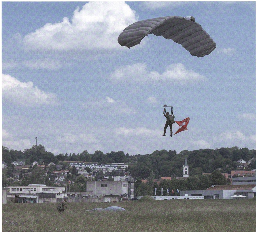
Fallschirmaufklärer landet mit der Schweizerfahne.