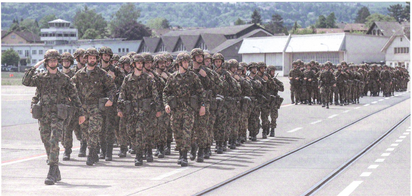
Einmarsch des Bataillons in Dübendorf.