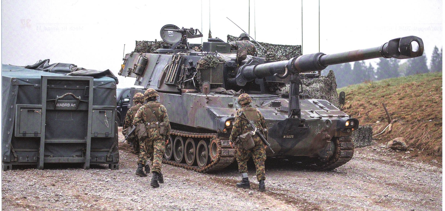
Eine Panzerhaubitze M-109 der Art Abt 10 wird in der vorgeschobenen Versorgungsstaffel auf den Säntisalpen aufmunitioniert.

- und Lehren für die Ausbildung und für weitere Übungen zu ziehen.