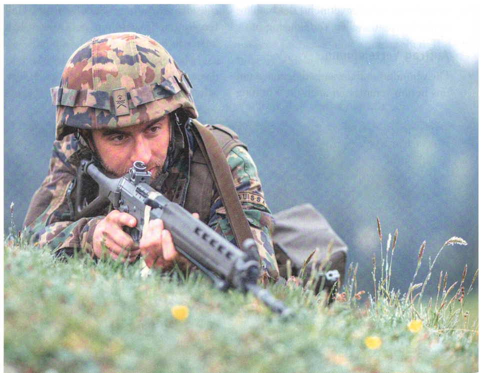
Ein Wachtmeister sichert seinen Abschnitt.