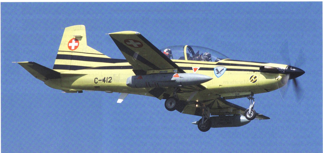
Jubilar Nummer 2: Seit 30 Jahren leistet der PC-9 der Luftwaffe beste Dienste.