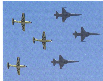
Je 3 x F-5 Tiger und PC-9