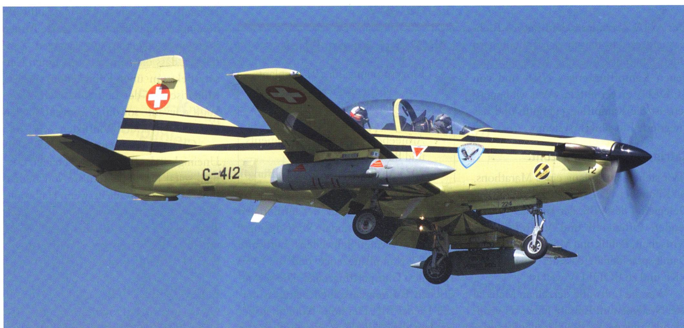
Jubilar Nummer 2: Seit 30 Jahren leistet der PC-9 der Luftwaffe beste Dienste.