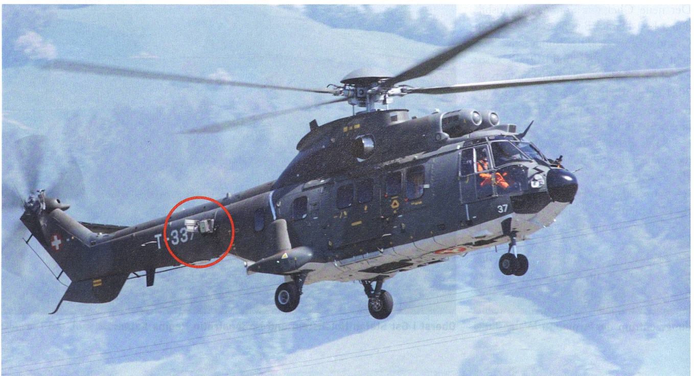
Auf dieses Bild legt Franz Knuchel Wert: Es zeigt erstmals den Cougar T-337 mit der Flares-Einrichtung vor der Nummer.