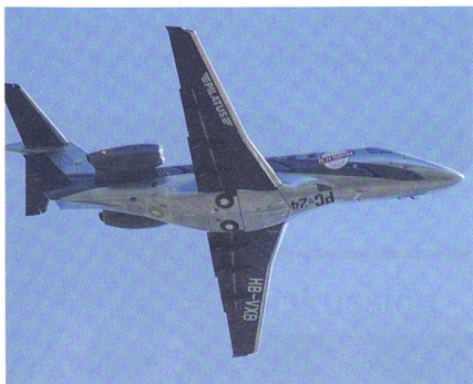
PC-24 von Pilatus.