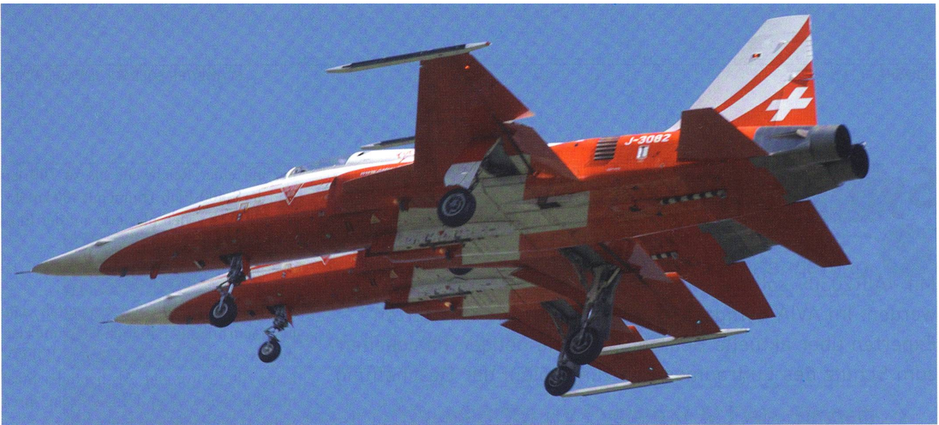
Jubilar Nummer 1: Der F-5 Tiger fliegt nach 40 Jahren weiter, hier als Flugzeug der Patrouille Suisse.