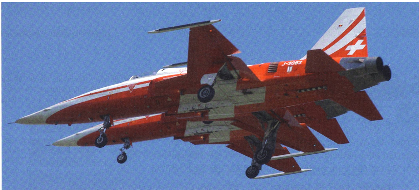
Jubilar Nummer 1: Der F-5 Tiger fliegt nach 40 Jahren weiter, hier als Flugzeug der Patrouille Suisse.