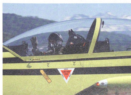
PC-9 von Pilatus.