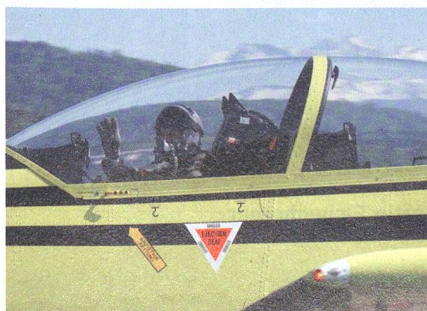
PC-9 von Pilatus.