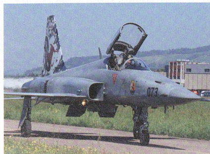
F-5 Tiger von Northrop.