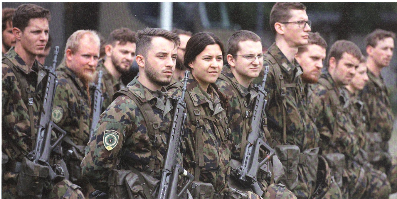
Auf dem Auslandschweizerplatz in der Bucht von Brunnen: Die würdige Fahnenzeremonie des Sanitätslogistikbataillons 81.