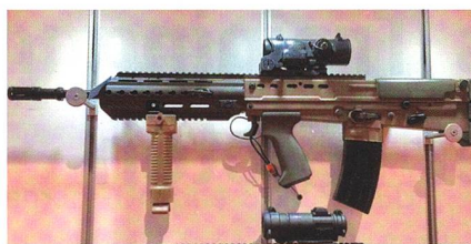
Modernisiertes Sturmgewehr L85A3 für die britische Armee.

Die British Army modernisiert ihre Handwaffen. So soll das SA80A3 bzw. L85A3 demnächst an die gesamte Truppe kom-