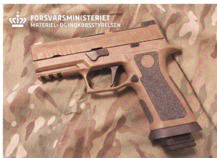
SIG P320 X-Carry für dänische Armee.

Die SIG P320 durchlief mit drei weiteren Waffen ein mehrwöchiges Auswahlverfahren, in dem taktische Handhabung, Treffsicherheit, Zuverlässigkeit und Ergo-