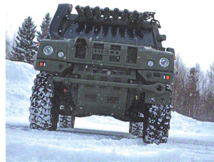
Letzte Tranche des LAV für Norwegen.