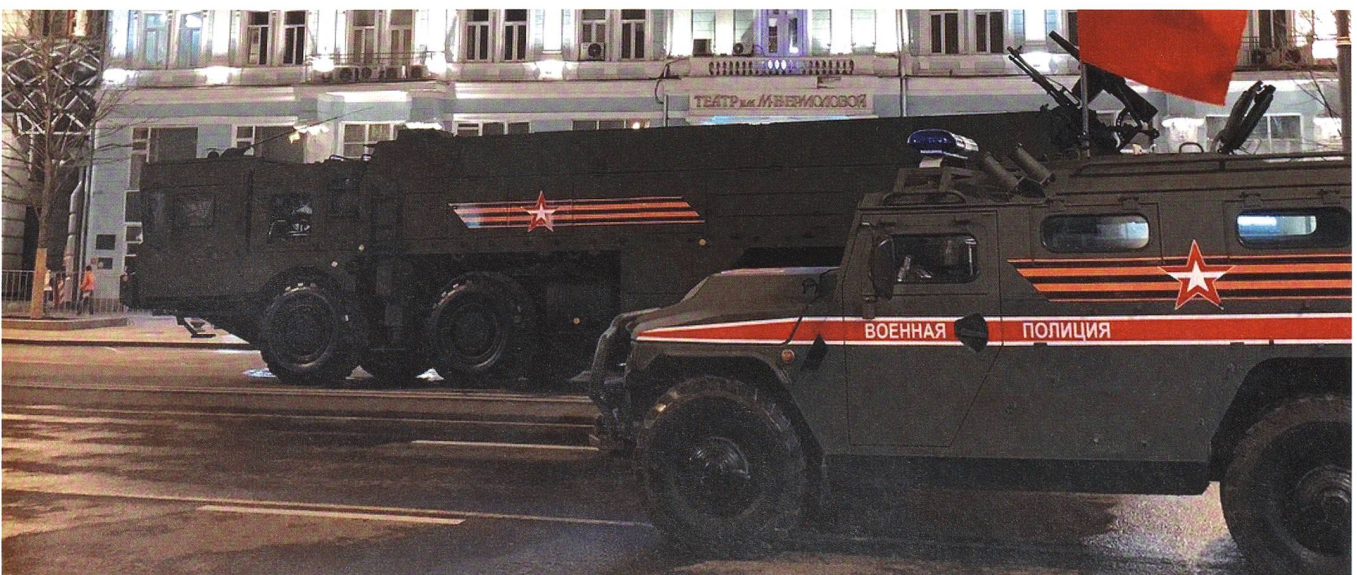
Vorne ein Tigr der Militärpolizei, hinten ein Militärtransporter mit vorgeschobener Kabine zum Minenschutz.