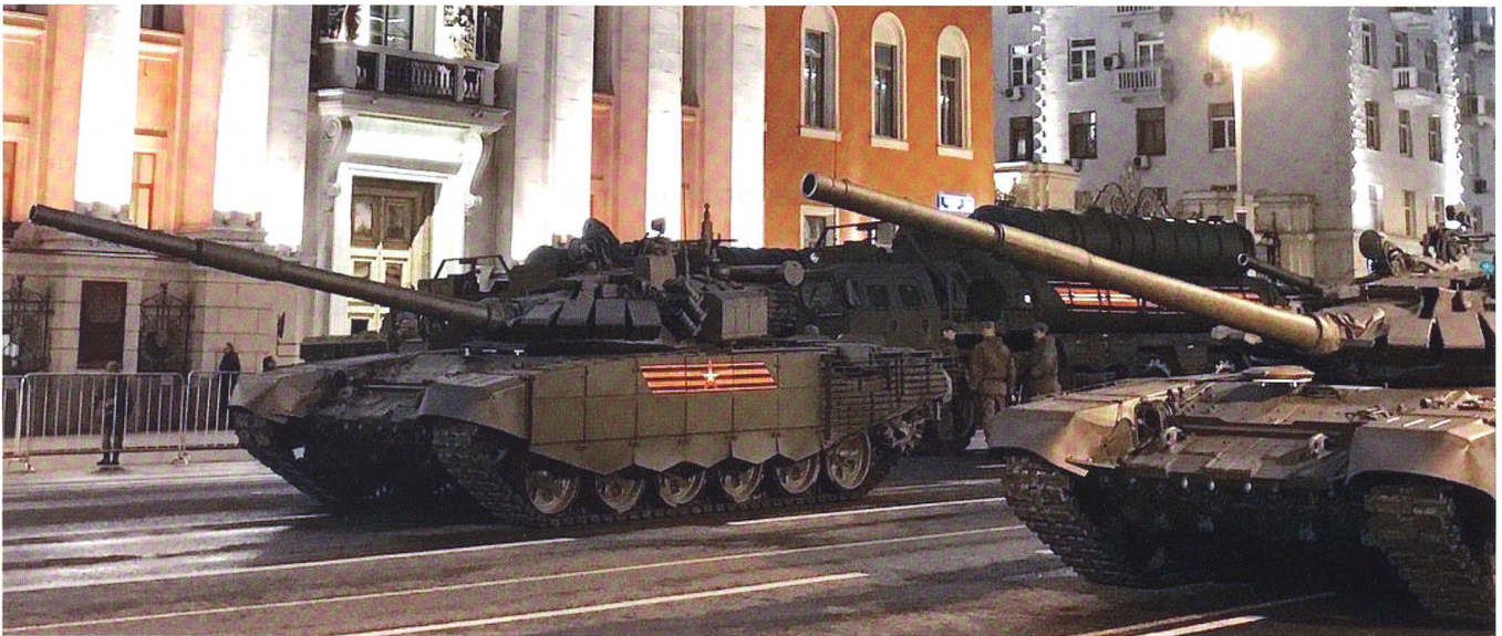
Der T-90-Tank bildet ein Fundament der russischen Panzertruppe, bis der neue T-14-Armata in grosser Zahl eingeführt ist.