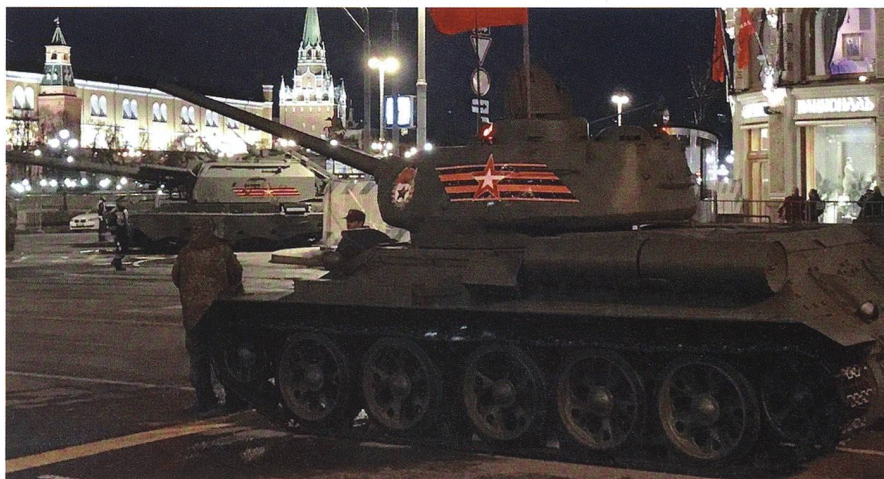
Der T-34-Tank rückte 1941–1945 von Sibirien und Stalingrad bis Berlin vor.

Die Bilder von 2018 verdanken wir der Fotografin Anna Savenko, Mitglied unseres trefflichen Korrespondenten-teams in Russland. Nostalgiker finden rechts den legendären T-34, der am Sieg gegen die Wehrmacht Anteil hatte.