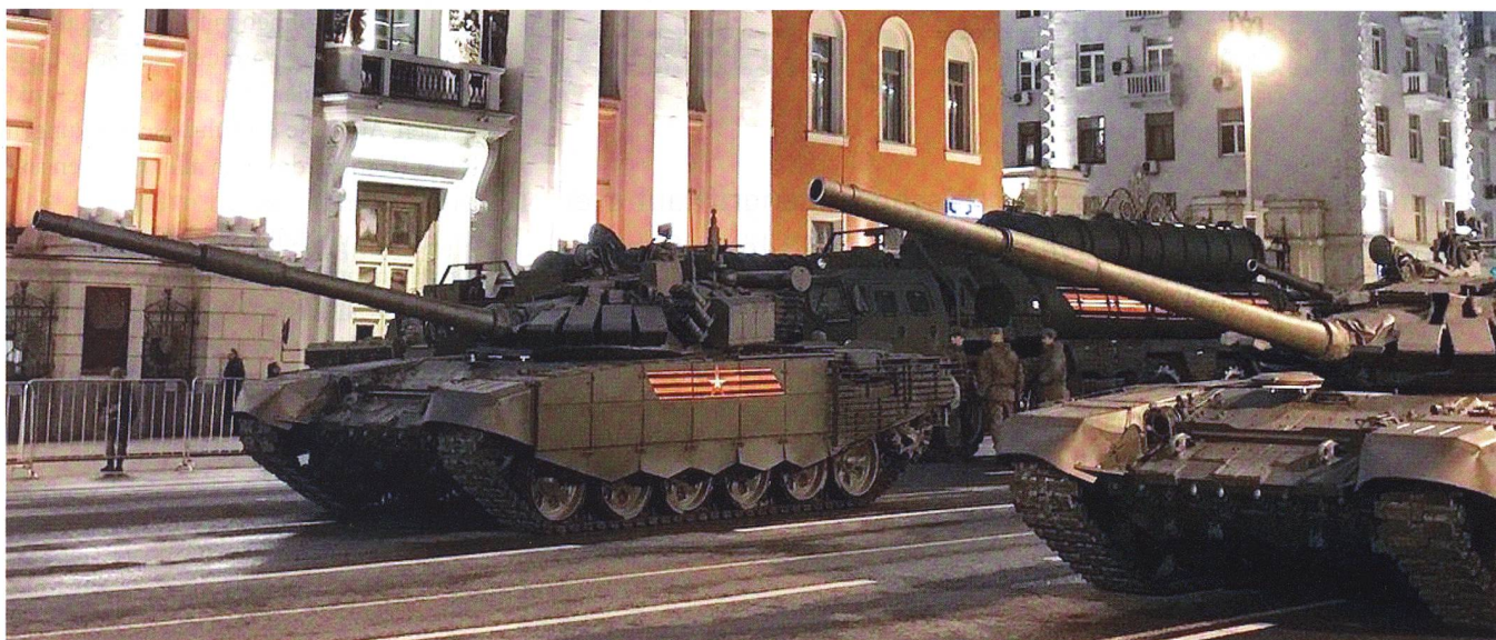
Der T-90-Tank bildet ein Fundament der russischen Panzertruppe, bis der neue T-14-Armata in grosser Zahl eingeführt ist.