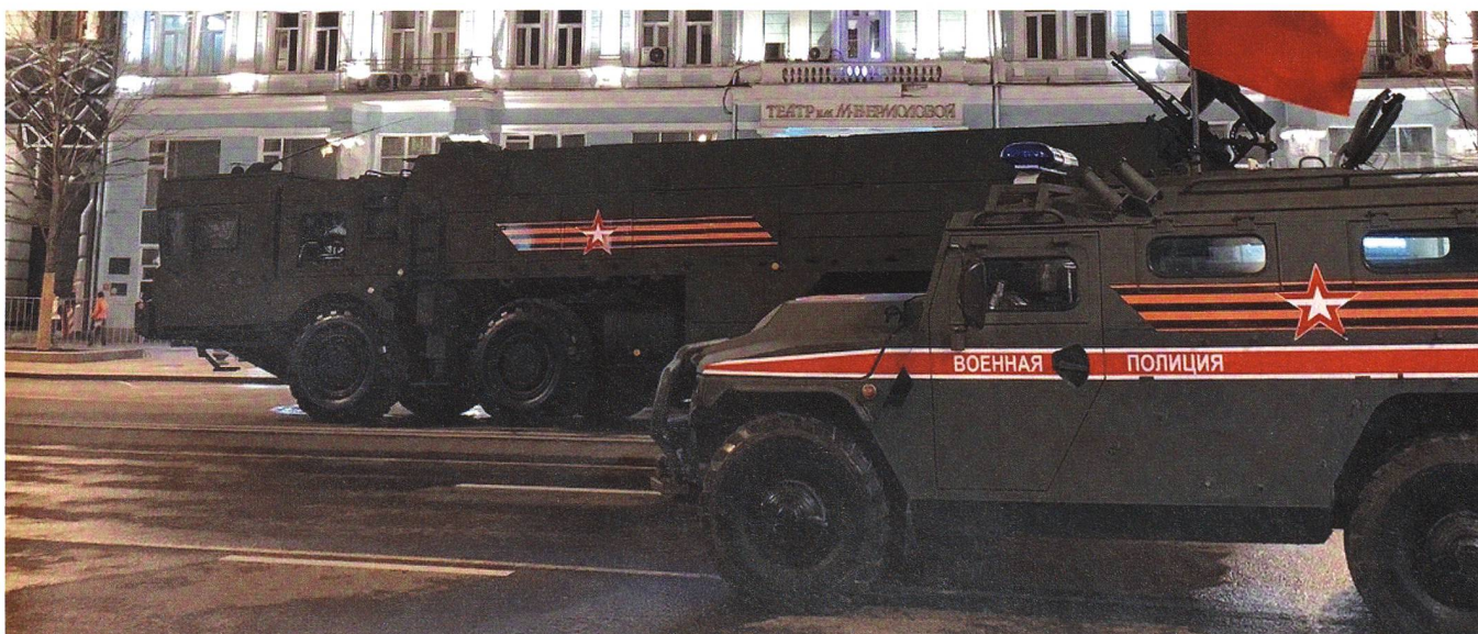
Vorne ein Tigr der Militärpolizei, hinten ein Militärtransporter mit vorgeschobener Kabine zum Minenschutz.