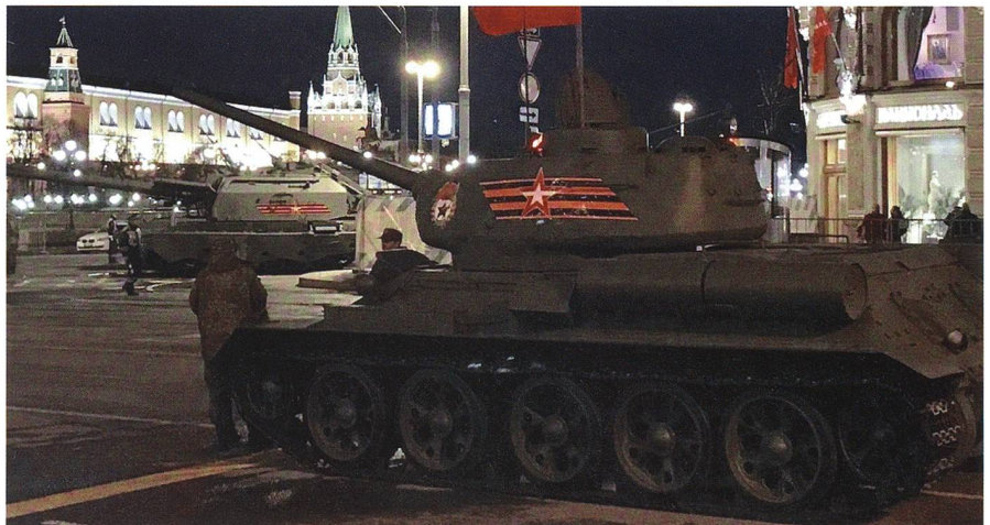
Der T-34-Tank rückte 1941–1945 von Sibirien und Stalingrad bis Berlin vor.

Die Bilder von 2018 verdanken wir der Fotografin Anna Savenko, Mitglied unseres trefflichen Korrespondententeams in Russland. Nostalgiker finden rechts den legendären T-34, der am Sieg gegen die Wehrmacht Anteil hatte.