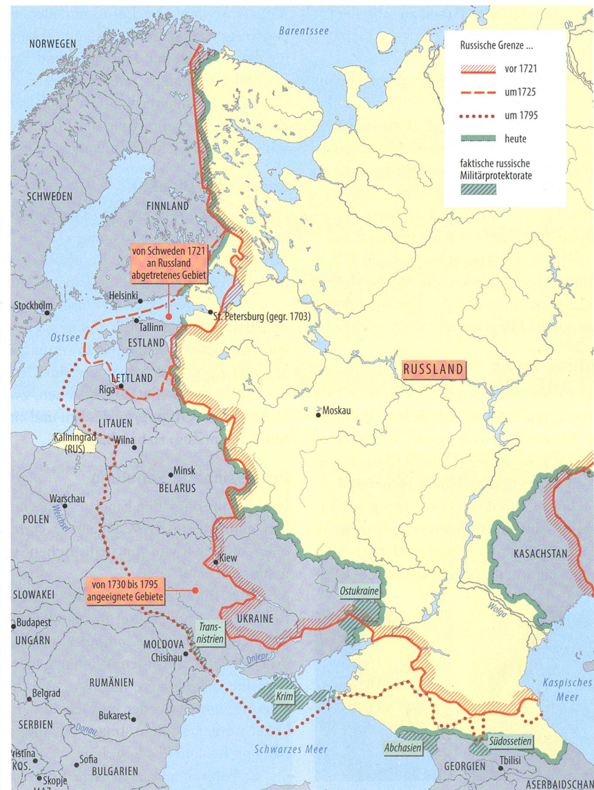
Karte aus dem Lagebericht des Nachrichtendienstes des Bundes, Seite 28.