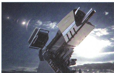
RUAG COBRA Mörsersystem

Das RUAG COBRA 120mm Mörsersystem ist ein Hightech-Produkt, das neue Massstäbe für indirekte Feuersysteme setzt. Ein elektrischer Antrieb und eine halbautomatische Ladevorrichtung sorgen für entscheidende Präzision und Schnelligkeit. RUAG COBRA kann einfach auf jedem Rad- oder Kettenfahrzeug montiert werden und ist so ausgelegt, dass die Nutzer das System schon nach kurzer Schulungsdauer versiert einsetzen können.