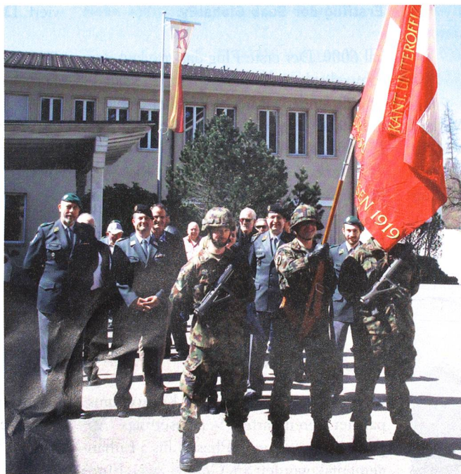
Der Fahnenzug führt die DV-Teilnehmer zum gemütlichen Teil an.