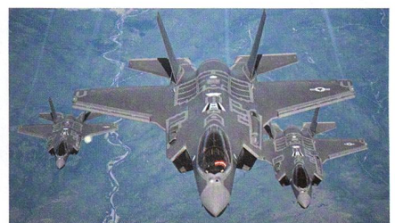
Erste F-35-A für Südkorea produziert.

Lockheed Martin hat in Fort Worth die erste F-35A Lightning II für die Luftstreitkräfte Südkoreas offiziell präsentiert. Der Stealth-Fighter mit der Produktkennung AW-1 hatte im März seinen Erstflug absolviert. Die Maschine wird im Frühjahr zur