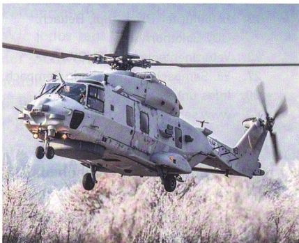
Militärhelikopter NH90 für den Katar.

Auf der Rüstungsmesse DIMDEX hat Katar hat einen lange erwarteten Vertrag über den Kauf von 28 Militärhelikoptern des Typs NH90 unterzeichnet. Die Vereinbarung im Wert von drei Milliarden Euro umfasst 16 NH90 für Transportaufgaben (TTH) und 12 NH90 für die Marine