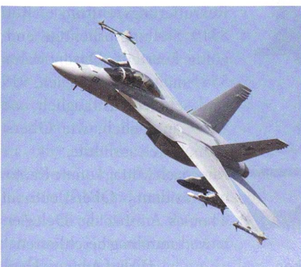
Neue F/A-18 E/F für den Kuwait.

Das Pentagon hat am Freitag den Verkauf von 28 Boeing F/A-18E/F an Kuwait im Wert von rund 1,2 Milliarden Dollar bestätigt. Der Export der neuen Kampfflug-