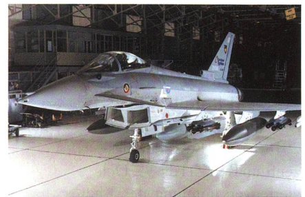
Neuste Eurofighter-Variante P1Eb.

Im Zuge der durch die vier Konsortiumspartner vereinbarten Verbesserungs-/Anpassungsprogramme (Phase 1 bis 3 Enhancements) wurden in Getafe zwei Eurofighter der aktuellsten Version (P1Eb Further Works) an die spanische Luftwaffe