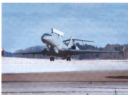
Erstflug der Saab GlobalEy.

Im März startete der erste Saab GlobalEye in Linköping zu seinem erfolgreichen Jungferflug. Das neue Frühwarnflugzeug basiert auf dem Bombardier Business Jet Glo-