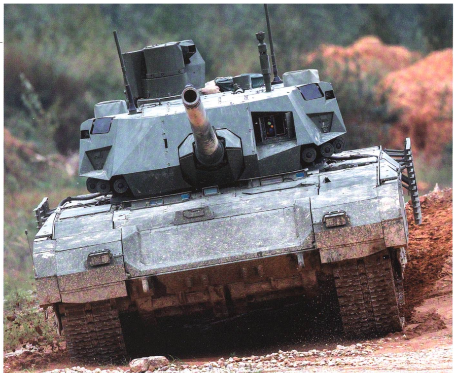
T-14 im Gelände. Die Ketten sind schmaler als beim Leopard oder Abrams.

Mit dieser Technologie könnte der Kdt eines T-14 sogar noch deutlich mehr sehen als der Chef eines Kampfpanzers mit bemanntem Turm. Eine ganz andere Frage ist in diesem Fall aber der Preis: Der Piloten-