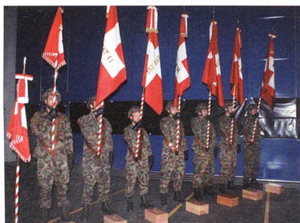
Die Feldzeichen des neuen Verbandes.