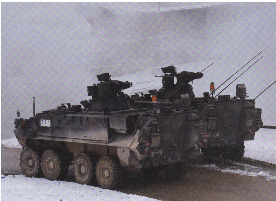
Pulverdampf und Schneetreiben: Zwei Piranha schützen mit ihren MG die Flanke.

Aus Bure berichtet Major Adrian Rüst, Ter Div 4, über die VTU «FANTASSIN» des Inf Bat 61