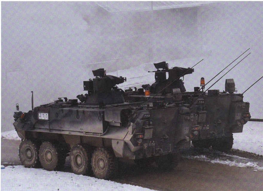
Pulverdampf und Schneetreiben: Zwei Piranha schützen mit ihren MG die Flanke.

Aus Bure berichtet Major Adrian Rüst, Ter Div 4, über die VTU «FANTASSIN» des Inf Bat 61