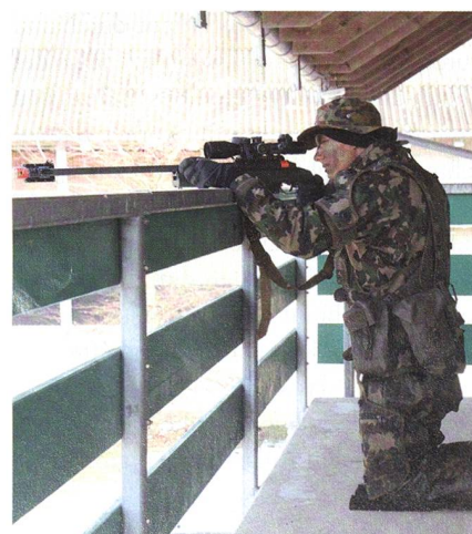
Scharfschütze (Kp 65/4). Mit den Mörsern gehören Scharfschützen zur 4. Kp.