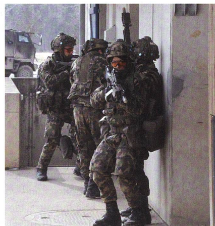
Eine Gruppe der Inf Kp 65/4 im Naté.

Der Autor stellt sich vor: Major der Infanterie, Kommunikation Ter Div 4, Jahrgang 1980, Diepoldsau SG, Master in Politik Uni Zürich (Nebenfächer: Neuzeitliche und Militärgeschichte).