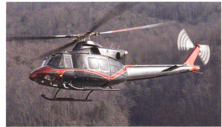
Helikopter von Bell für die Philippinen.

Mit den Helikoptern soll die philippinische Luftwaffe modernisiert werden. Sie werden für eine Vielzahl von Einsätzen wie Katastrophenhilfe, Such- und Rettungseinsätze, Personenbeförderung und Hilfs-