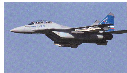
Erprobung der MiG-35 abgeschlossen.

Die Versuche wurden im Laufe des Jahres 2017 unter Beteiligung von Testpiloten des russischen Verteidigungsministeri-