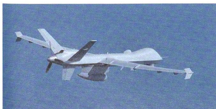
Drohnen Predator B «Sea Guardian».

Die indische Marine sieht jedoch einen Bedarf an bewaffneten Drohnen, welche entsprechende Aufgaben in der Region des indischen Ozeans durchführen. Eine mögliche Lösung könnte die in Indien ent-