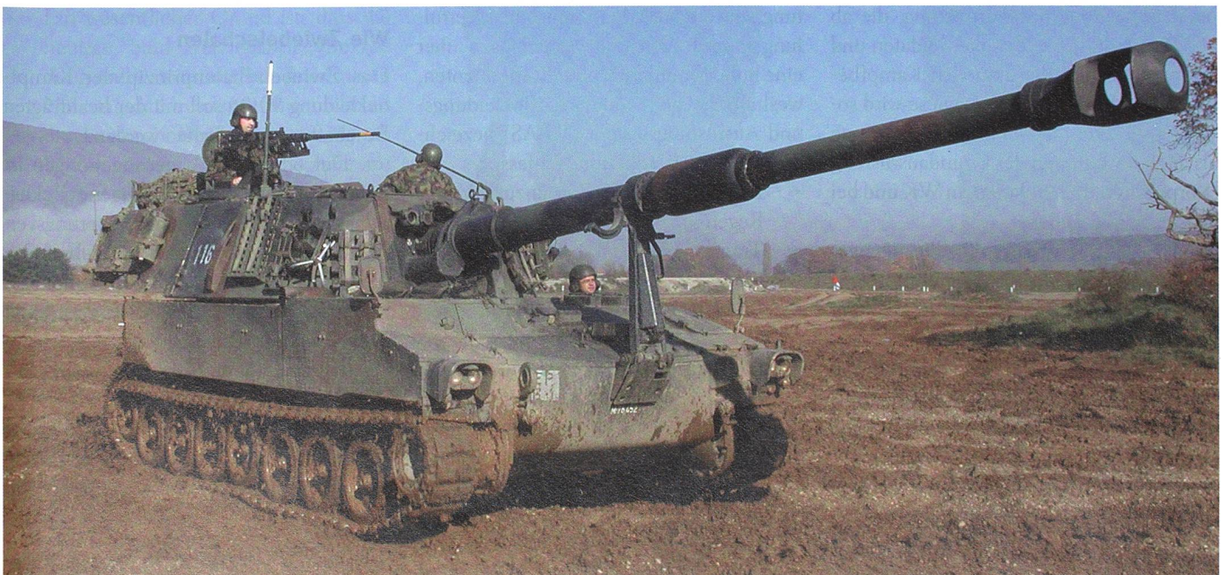
Die nicht wertgesteigerten Pz Hb M-109 sollen samt den dazu gehörenden Raupentransportwagen abgeschafft werden.