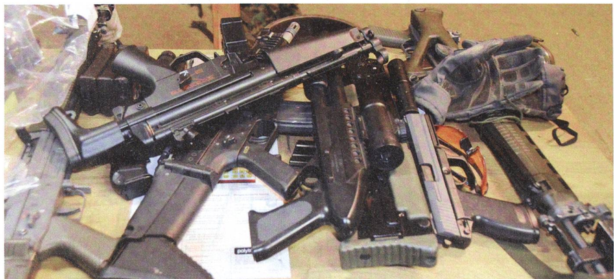
Beschlagnahmtes Volpodinger Material, vornehmlich Schusswaffen!