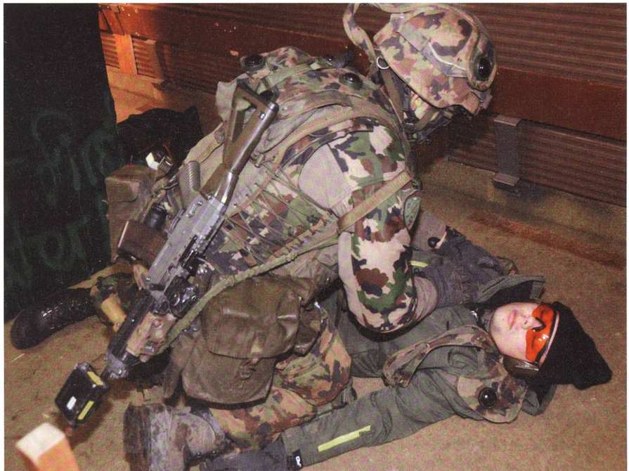
Festnahme von Volpodinger Aktivisten im Schützenhaus Hermetschwil.