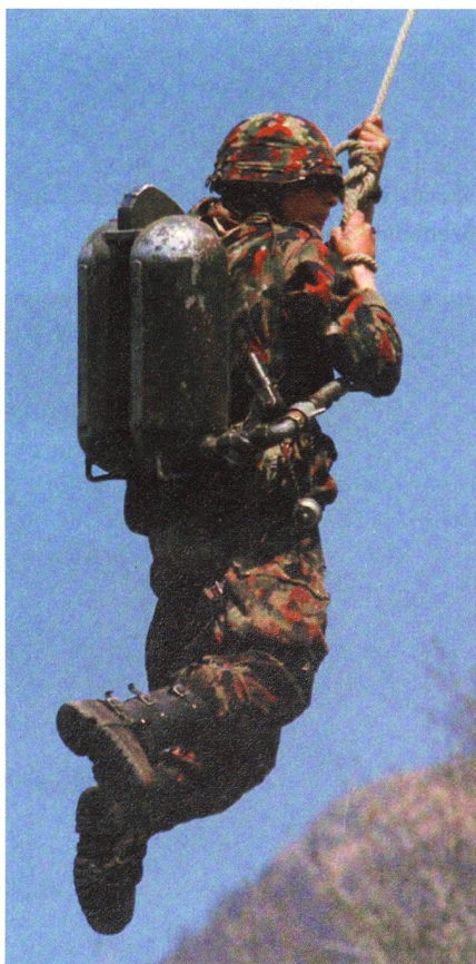
Grenadier mit Flammenwerfer 42/55. Mut und Todesverachtung 1954.