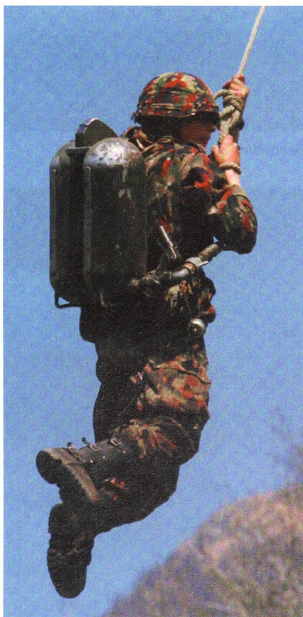
Grenadier mit Flammenwerfer 42/55. Mut und Todesverachtung 1954.