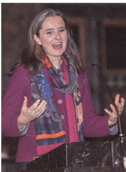
Grussbotschaft der Luzerner Nationalrätin Yvette Estermann.

Der Medizinerin ist es ein Rätsel, warum es in unserem Land immer noch Kräfte gibt, die versuchen, unsere Armee zu schwächen oder abzuschaffen! Dabei seien die Zeiten in der Tat bewegter denn