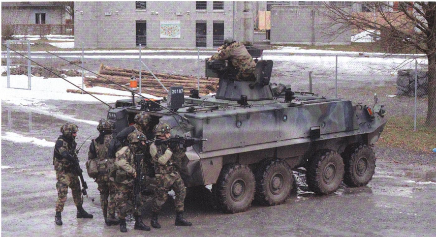
Das Inf Bat 61 und Durchdiener üben den Ortskampf – Seiten 25–27.