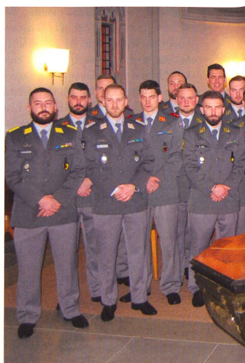
Der stolze GAL 2016-2017. In der Mitte vor dem

Ländern stammten, sich bei uns integrieren und einbürgerten. Sie bekennen sich zu unseren Werten, und ihre Kinder übernehmen Funktionen in unserer Armee.