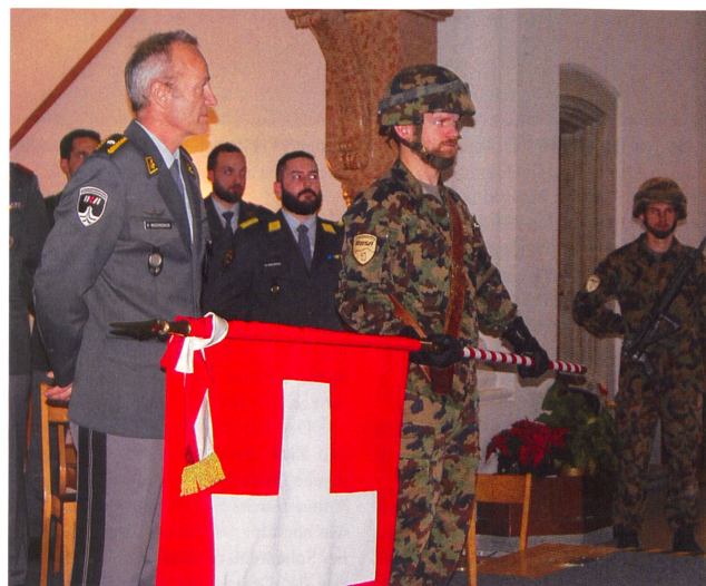
Br Niederberger und der Fähnrich sind zur Brevetierung bereit.