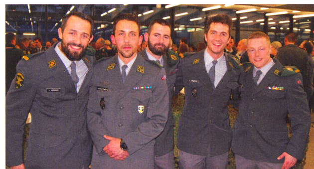
Es lebe die Infanterie mit ihrem Lehrverband und allen Waffenplätzen.

«Auf Ihrem Weg werden Sie mit Menschen Freude und Leid teilen! Es wird Tränen der Freude und des Leides geben, die Sie mit ei-