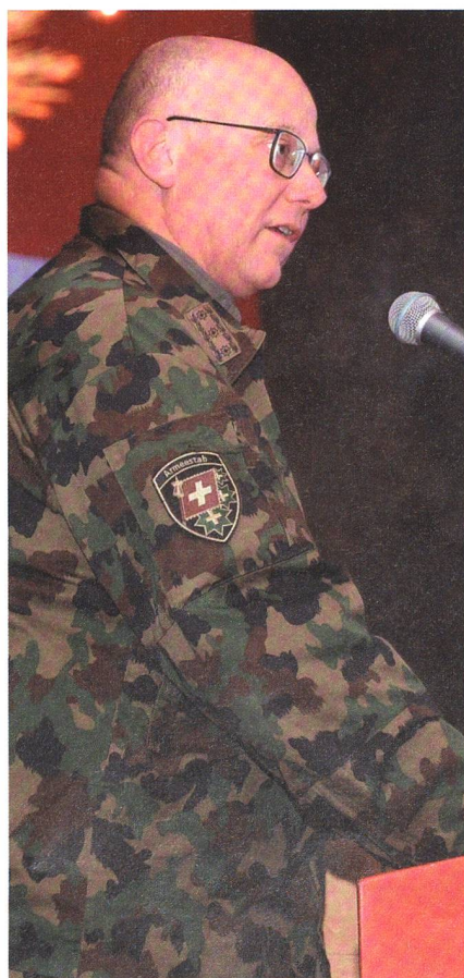
Der CdA dankt dem Kontingent für das grosse Engagement.

Die Herausforderungen sind vielschichtig. Patrouillengänge und Gespräche mit Behörden oder Privaten wollen sorgfältig geplant, durchgeführt und rapportiert sein. Die Vertrauensbasis ist vorhanden, und