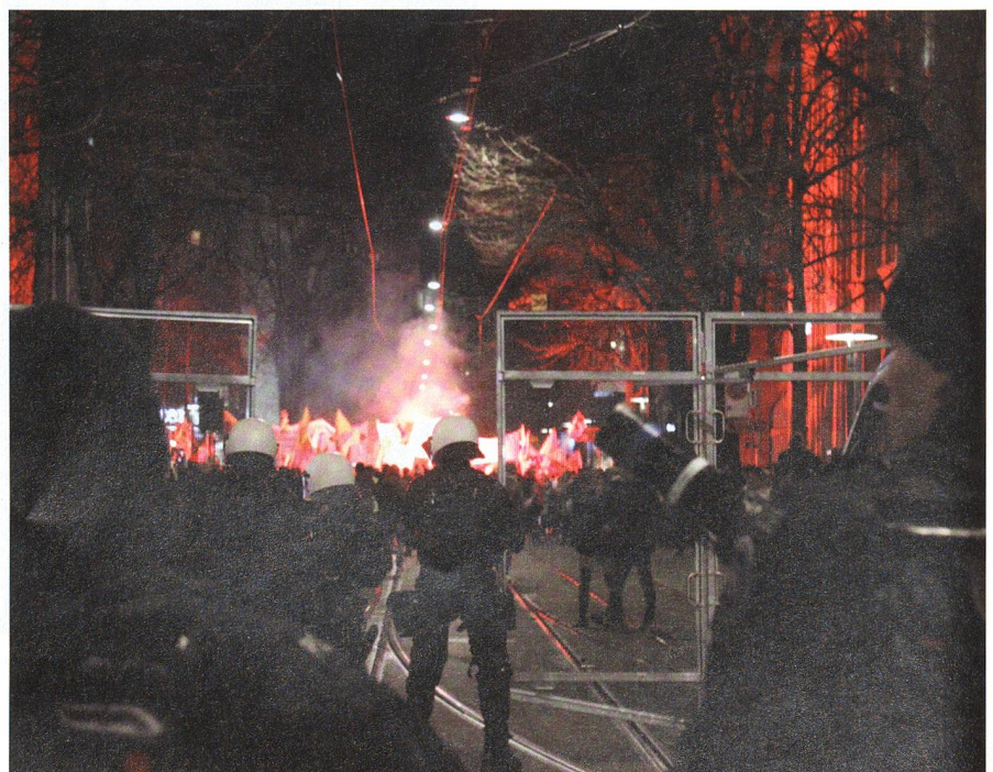
Die Demonstranten sind in die Bahnhofstrasse eingebogen. Polizisten verhindern das Durchbrechen zum Paradeplatz.