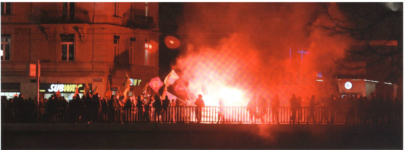
23. Januar 2018, Zürich. Auf der Sihlbrücke zünden linksautonome Chaoten Pyros.