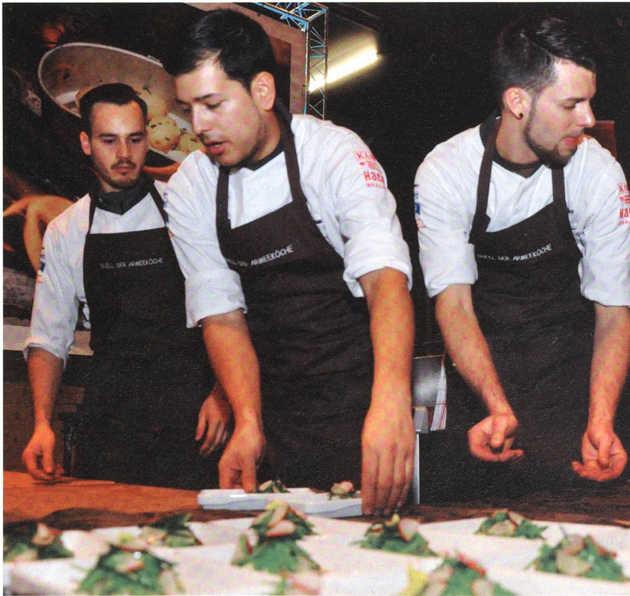
Schweizer Spitzenköche am Werk.

Während fünf Tagen massen sich die Köche des Swiss Armed Forces Culinary Teams mit ihren deutschen Kameraden von der Koch-Nationalmannschaft der Bundeswehr. An der Igeho in Basel versuchten sie sich gegenseitig mit ihren gaumenschmeichelnden Kreationen zu übertreffen und haben dabei Kochkunst in Perfektion zelebriert. Dabei brachten sie dem Fachpublikum die Leidenschaft der militärischen Köche näher.