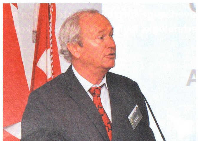
Regierungsrat Paul Winiker, treuer Fürsprecher der Armee.