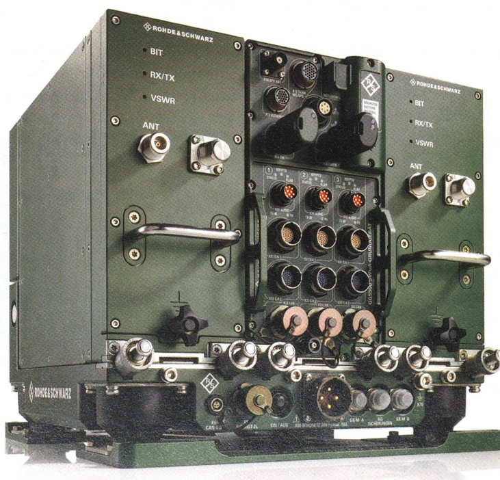
Spitzenprodukt von Rohde & Schwarz.