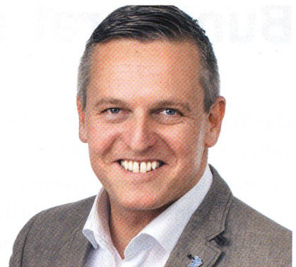
Heeresminister Mario Kunasek findet die Kritik an der FPÖ überrissen.

Mario Kunasek, der neue österreichische Verteidigungsminister, sieht die teure Eurofighter-Flotte als «dringende Angelegenheit». Kritik an der Machtkonzentration bei den Machtministerien Inneres und Heer kann er nicht nachvollziehen.