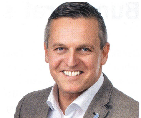
Heeresminister Mario Kunasek findet die Kritik an der FPÖ überrissen.

«Ich bekenne mich zu Österreichs Engagement im Ausland.» Für den ersten Truppenbesuch ausser Landes denkt Kunasek an den Balkan, wo das Bundesheer im Kosovo und in Bosnien stark vertreten