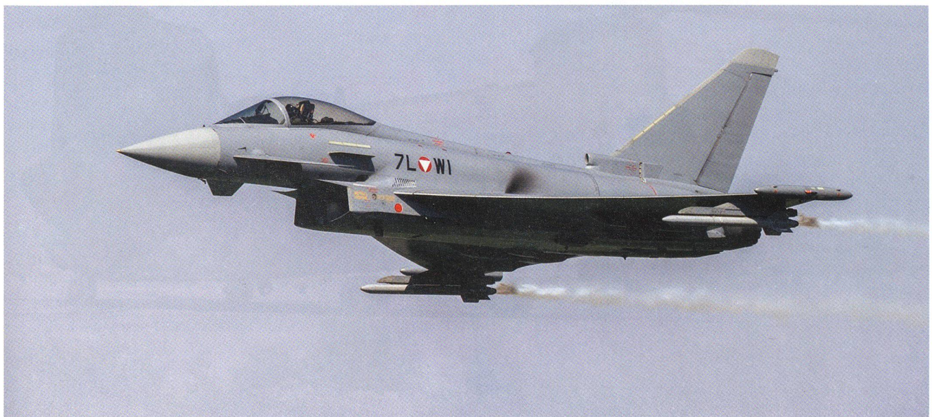
Eurofighter mit hohen Betriebskosten. Das alte Regime wollte ihn stoppen, das neue nicht.