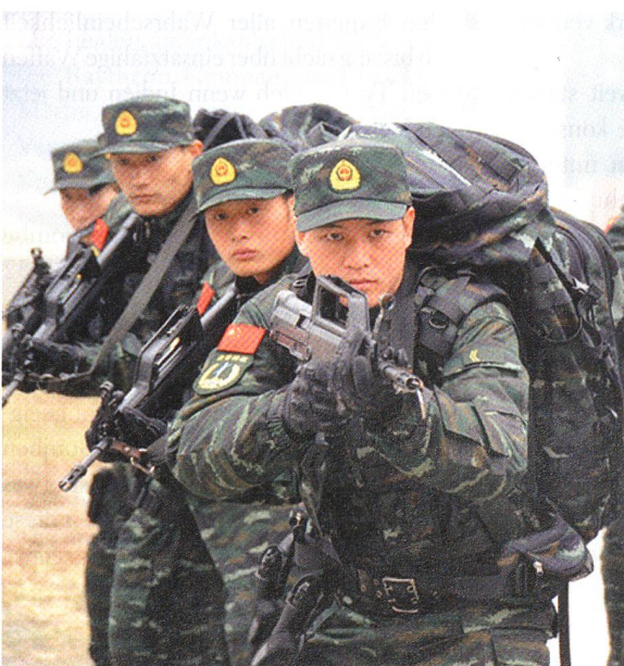
Bewaffnete Polizei, eine Elite.

Die gut gerüstete, 900 000 Mann zählende Truppe ist für die innere Sicherheit verantwortlich. Nach der unrühmlichen Rolle der