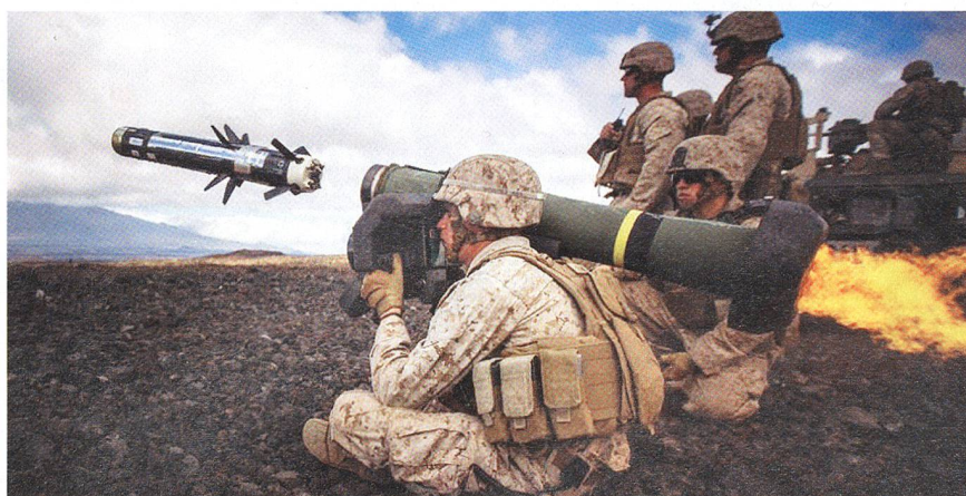
Pzaw-Schützen der US Army setzen Javelin ein. Besser nicht dahinter stehen!