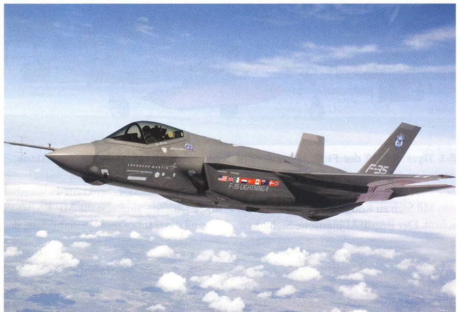
Die Bundeswehr liebäugelt mit dem Lockheed Martin F-35 Joint Strike Fighter.