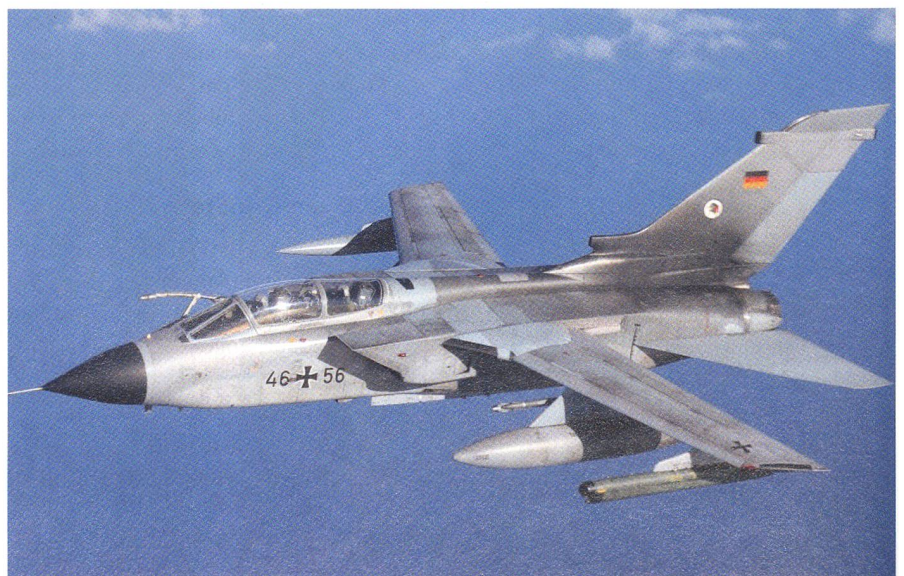
Der Tornado - dieses nukleare Schlachtross gilt es ab 2025 zu ersetzen.