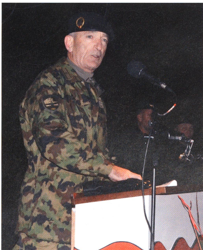
Br Langel, ein grosser Panzergeneral, tritt nach 4 Jahren ab.