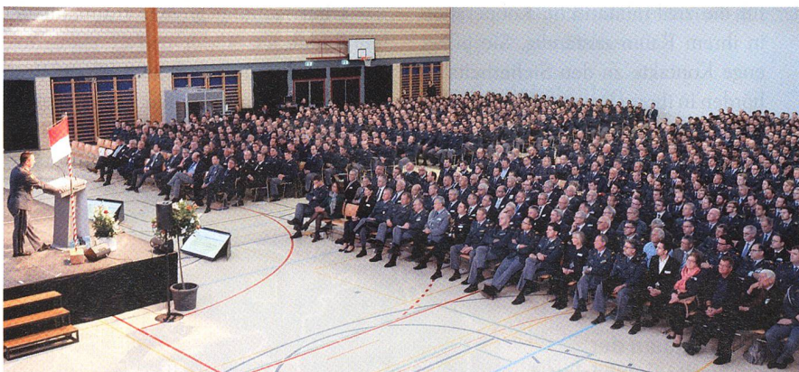
1000 Kader versammeln sich in Baar.