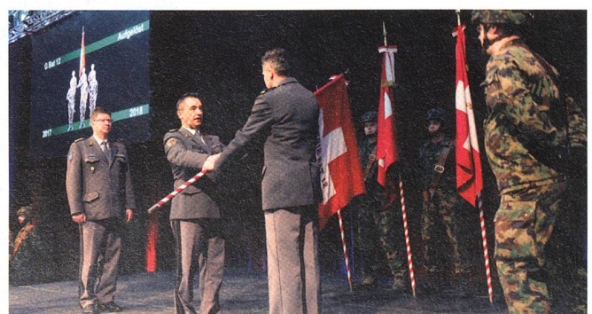
Fahnenrückgabe: Geniebataillon 12.