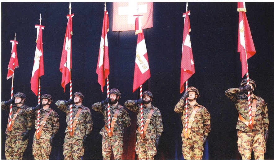
Die Feldzeichen der neuen Territorialdivision 3 in der Waldmannhalle Baar.

Mit der WEA rüstet die Armee für die Zukunft, die Umsetzung begann am 1. Januar 2018. Der Ter Reg 3 bringt die WEA Veränderungen. Sie heisst neu Ter Div 3 und sie muss sich von alten Bataillonen verabschieden und erhält neue Bataillone.