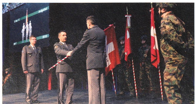
Fahnenrückgabe: Geniebataillon 12.