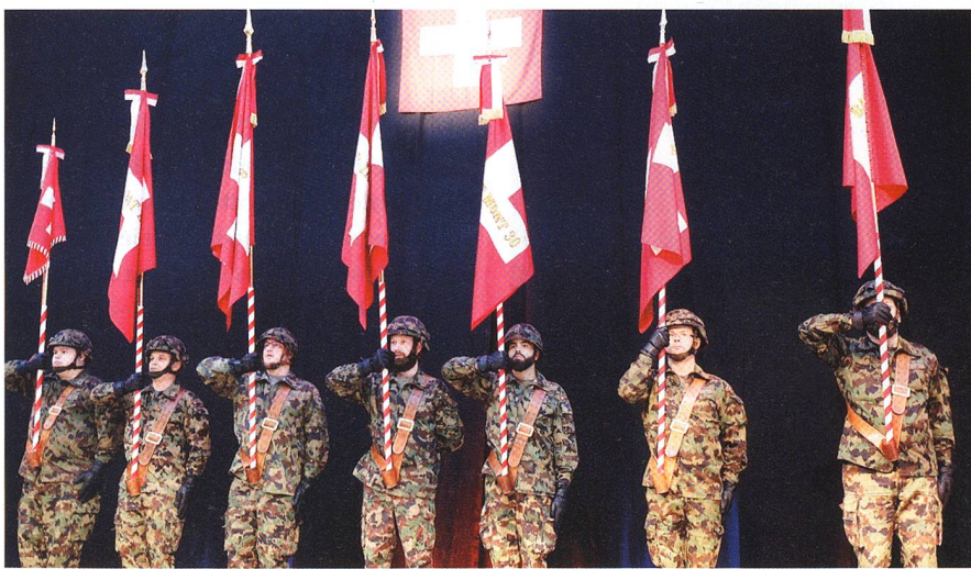
Die Feldzeichen der neuen Territorialdivision 3 in der Waldmannhalle Baar.

Mit der WEA rüstet die Armee für die Zukunft, die Umsetzung begann am 1. Januar 2018. Der Ter Reg 3 bringt die WEA Veränderungen. Sie heisst neu Ter Div 3 und sie muss sich von alten Bataillonen verabschieden und erhält neue Bataillone.