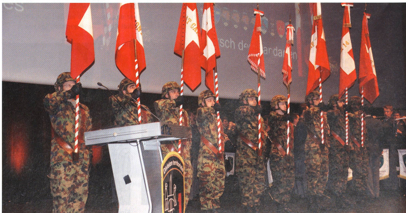
Die Feldzeichen der neuen Territorialdivision 1 in Montreux.

Der Ter Div 1 sind folgende acht Bat unterstellt: Ter Div Stabsbat 1, Inf Bat 13, Inf Bat 19, Schützen Bat 1, Schützen Bat 14, Geb Inf Bat 7, G Bat 2, Rttg Bat 1. Hinzu kommen die Koord Stelle 1 sowie das Kdo Patrouille des Glaciers.