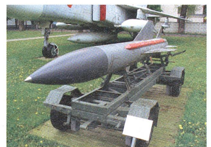
Luft-Boden-Rakete AS-11, Kilter.

Für moderne Raketen lägen bereits aussagekräftige Resultate vor, die es der KTRV erlaubten, die Missiles weiter zu entwickeln, namentlich die Kh-35UEh-Schiffsrakete und die Luft-Boden-Rakete Ch-58USchK IIR, die auf der AS-11 beruht. nov/msa.