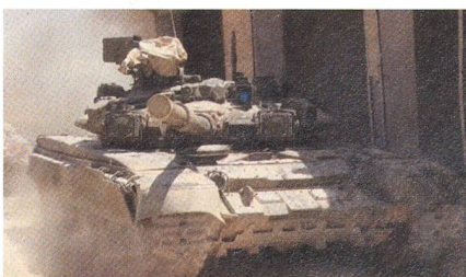
Abwehrsystem Shtora-1 auf dem Turm.