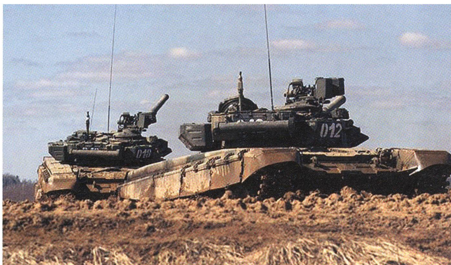
Zwei Standardpanzer T-90 des russischen Expeditionskorps im Syrienkrieg.