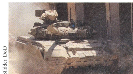
Abwehrsystem Shtora-1 auf dem Turm.