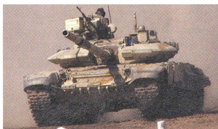
Russ. T-80BVM, 46 Tonnen, in Syrien.