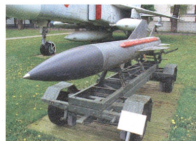
Luft-Boden-Rakete AS-11, Kilter.

Für moderne Raketen lagen bereits aussagekräftige Resultate vor, die es der KTRV erlaubten, die Missiles weiter zu entwickeln, namentlich die Kh-35UEh-Schiffsrakete und die Luft-Boden-Rakete Ch-58USchK IIR, die auf der AS-11 beruht. nov/msa.