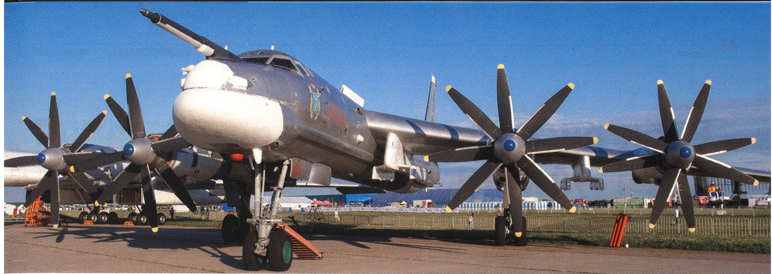
Der Fernbomber Tu-95 («BEAR»). Besitzt ein modernes Radar, eine mit der Satelliten-Navigation GLONASS kompatible Zielerfassung und trägt acht strategische Marschflugkörper vom Typ Ch-101 oder Ch-102-Raketen mit nuklearem Gefechtskopf.