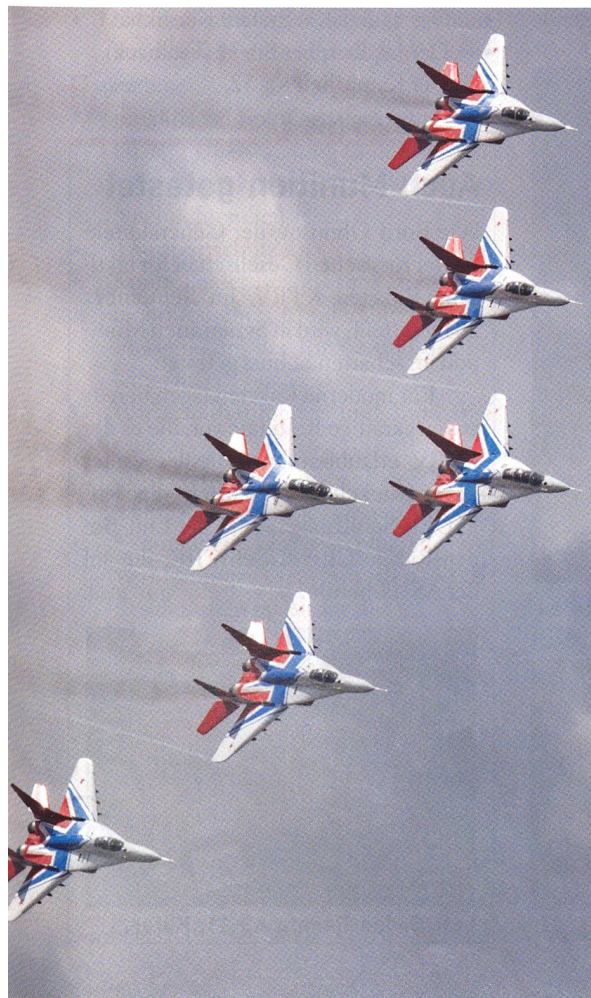
Die sechs Russischen Ritter stellen um von MiG-29 auf Suchoi 30SM.