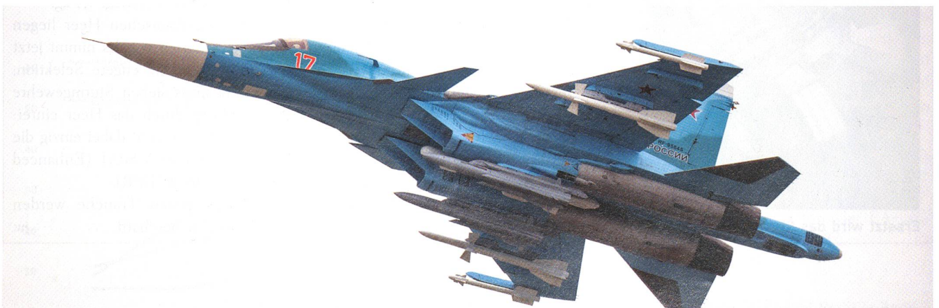
Der Suchoi-34-Pilot mit der Nummer 17 flog sein Programm mit Bewaffnung und zeigte einen glänzenden Kunstflug.