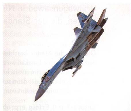
Aufstieg zu Pugachews Kobra. Steht still: Pugachews Kobra. Lässt nach vorne abfallen. Fängt den schweren Jet auf.