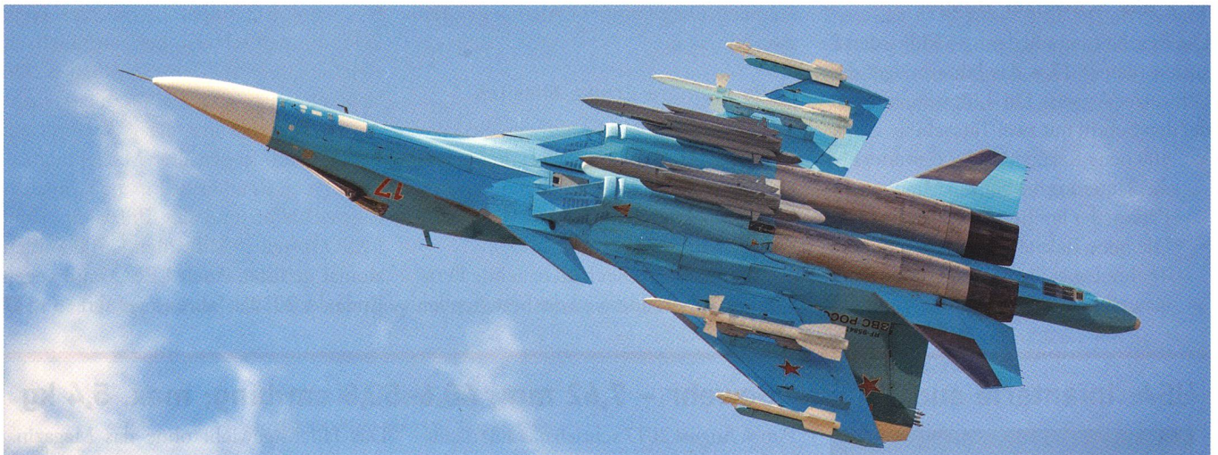
Der Displayflieger mit der Suchoi-34 und der Nummer 17 riss das anspruchsvolle Publikum zu Begeisterungstürmen mit.