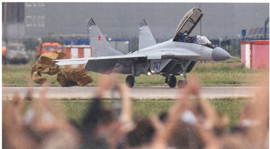
Nr. 747 landet am Bremsfallschirm. Einer der beiden Flieger winkt dem Publikum zu. Die besten Display- und Staffelpiloten genießen in Russland Heldenstatus.