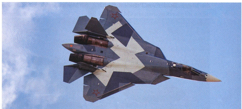
Den Höhepunkt jeder MAKS bildet der Suchoi T-50, ein Jet der 5. Generation.