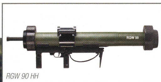
RGW 90 HH