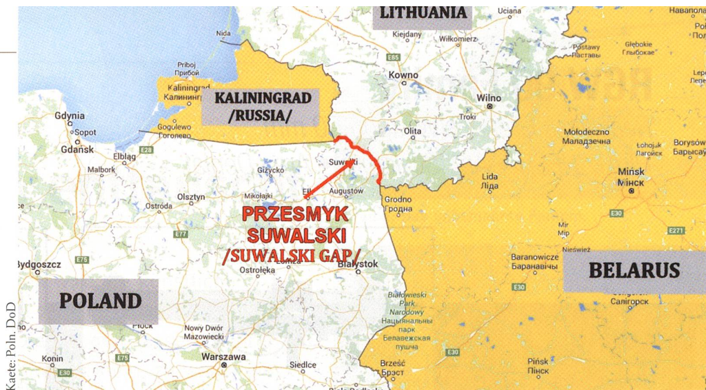
Rot die 65 km messende Suwalki-Lücke. Links Polen, gelb rechts Weissrussland (Belarus), Mitte Russland/Kaliningrad, oben Litauen. Operativ ist die Lücke eng.

Welche Entwicklungen sind durch Digitalisierung und Robotertechnologie vorherzusehen? Welche Auswirkungen haben «Künstliche Intelligenz», «Cyber warfare» und «Information warfare»? Durch letztere sollen Bevölkerung und Soldaten eines