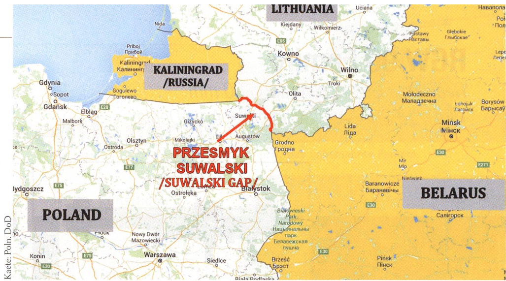
Rot die 65 km messende Suwałki-Lücke. Links Polen, gelb rechts Weissrussland (Belarus), Mitte Russland/Kaliningrad, oben Litauen. Operativ ist die Lücke eng.

Welche Entwicklungen sind durch Digitalisierung und Robotertechnologie vorherzusehen? Welche Auswirkungen haben «Künstliche Intelligenz», «Cyber warfare» und «Information warfare»? Durch letztere sollen Bevölkerung und Soldaten eines