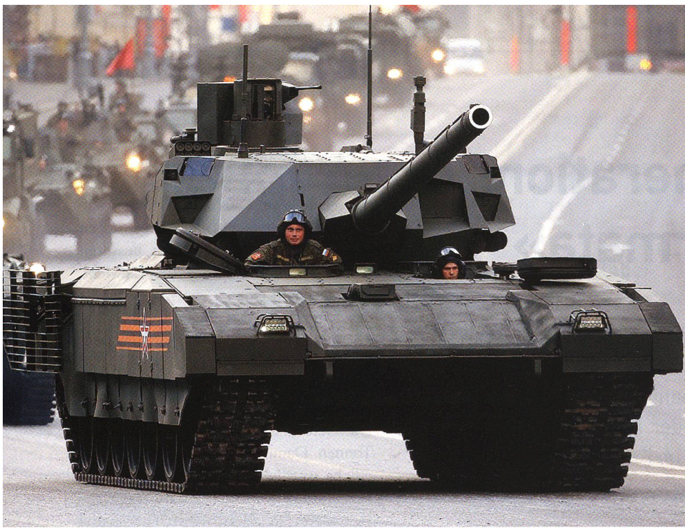
So wurde der T-14 schlagartig bekannt: Am 9. Mai 2015 auf dem Roten Platz.

seine Granate aus einer Distanz von 50 bis 150 Meter auf den Panzer schiesst, so schützt das System den Panzer nicht. Es tritt gar nicht in Funktion.